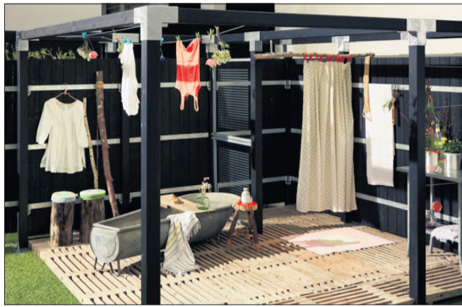
Stolper og lignende elementer kan også bruges til at lave badeværelse i haven.

Mange har fået installeret udekøkken, så der er mulighed for at skylle salaten under rindende vand og hakke tomaterne uden at skulle flytte inden døre, når vejret