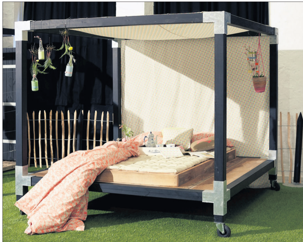
Soveværelse i have-udgave.

og nyde udsigten over naturen, mens udebruseren skylles strandsand og havsalt af kroppen eller lader de kolde stråler vække én om morgenen. Men der er flere muligheder for at genskabe boligens rum ude i haven, mener man hos danske Plus.