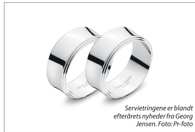
Servietringene er blandt efterårets nyheder fra Georg Jensen.

Servietringene er i rustfrit stål, og designet er så enkelt,